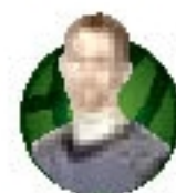
SUHAJDA ZOLTÁN WWW.METROPOL.HU

Jelenleg Magyarországon mintegy százezer autót köröznek. Ha ezek rendszám-tábláit egymás után tennék, akkor a sor ötven kilométer hosszú lenne.