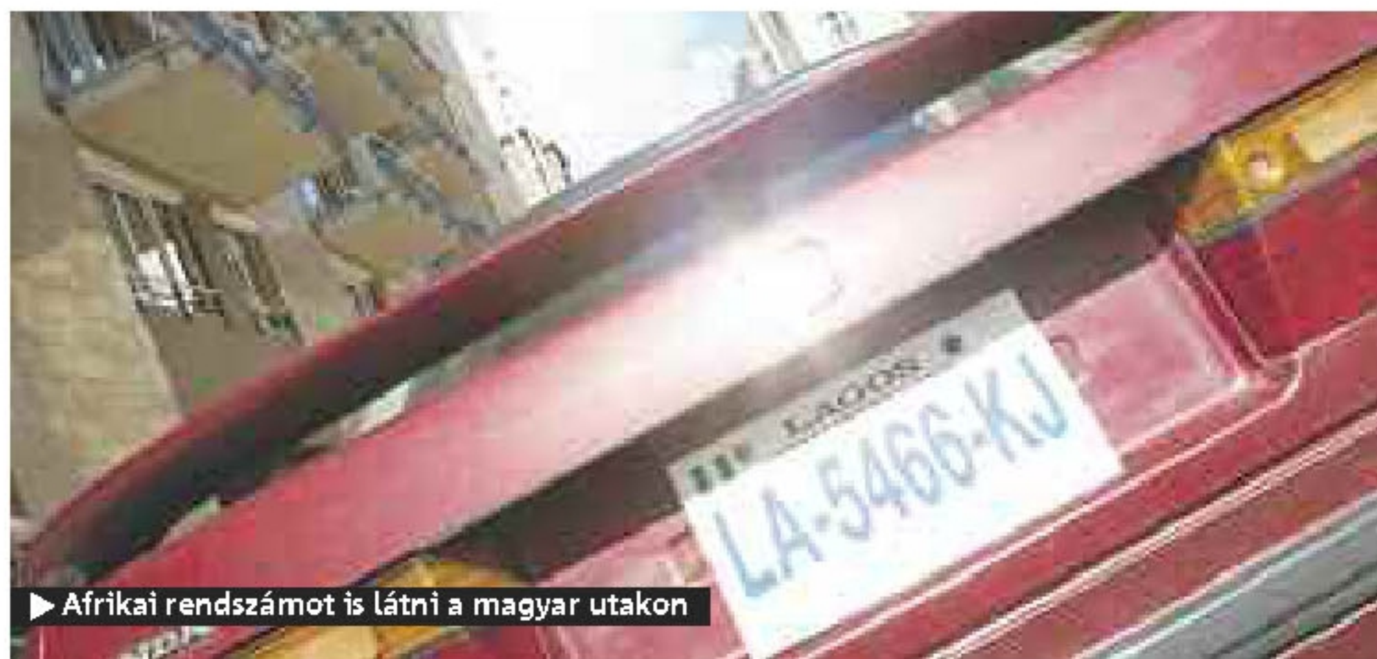
▶ Afrikai rendszámot is látni a magyar utakon

Rendőrok, polgárőrök és civilek kutattak lopott és más ok miatt körözött autók után a hetedik civil autóvadász kupán.