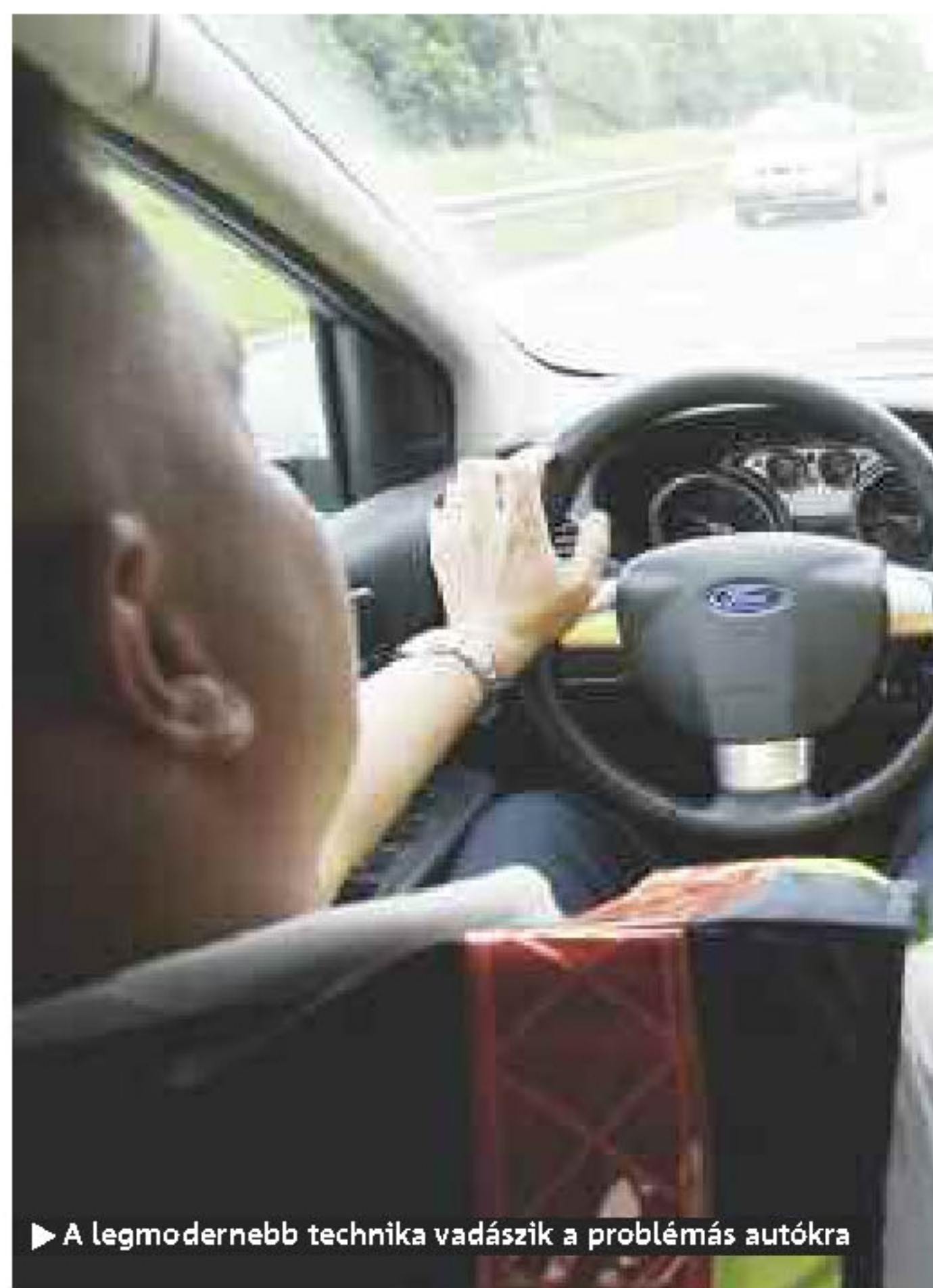
▶ A legmodernebb technika vadászik a problémás autókra

▶ A válság érezhetően növelte a lopások számát ▶ Jelenleg 100 000 autót keresnek a magyar utakon